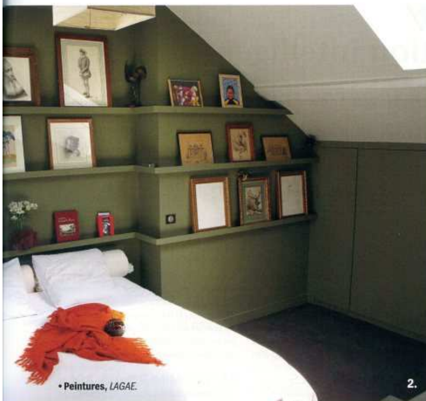
• Peintures, LAGAE.