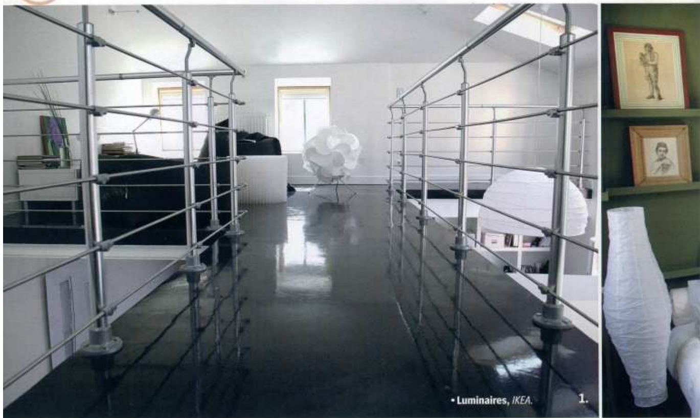
• Luminaires, IKEA.