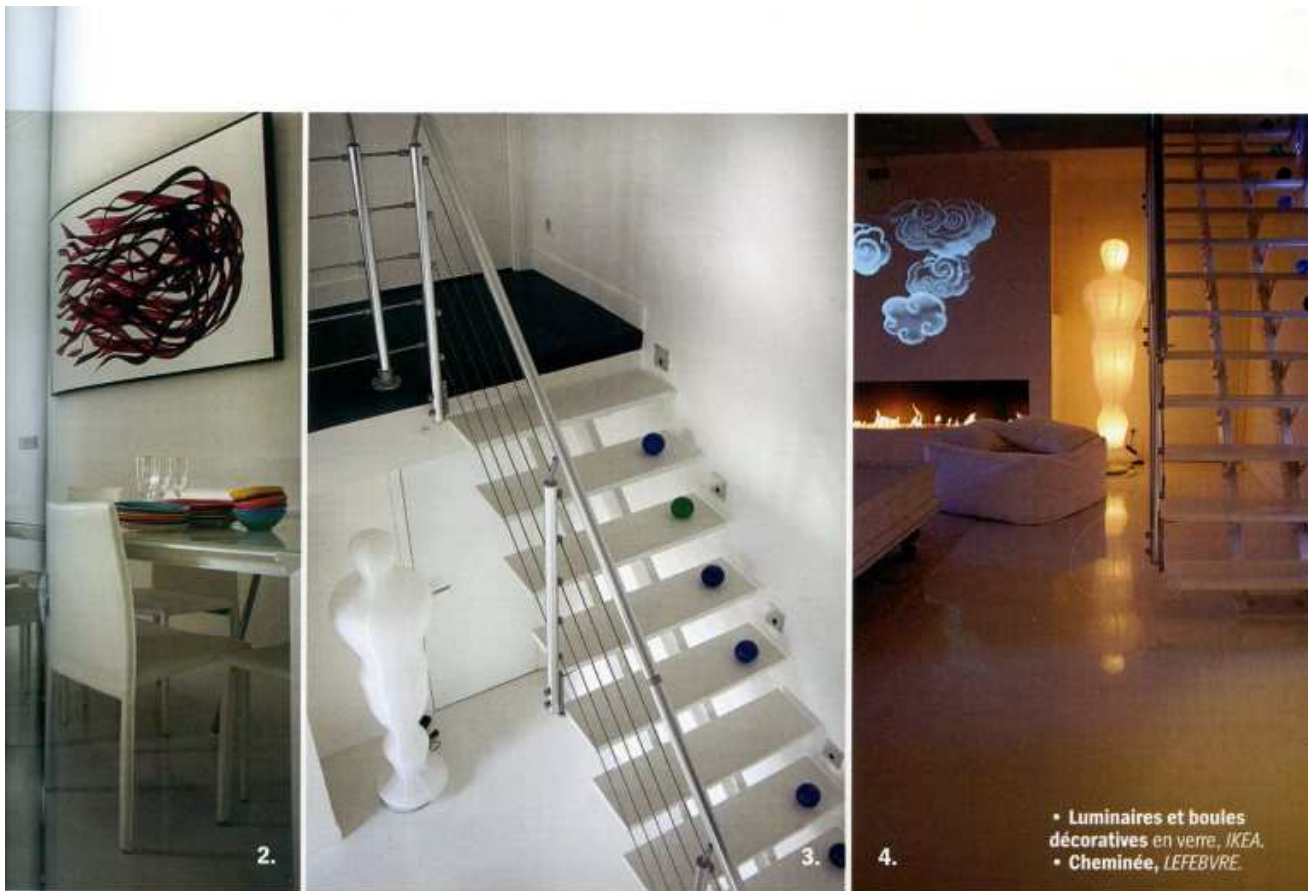
• Luminaires et boules décoratives en verre, IKEA . • Cheminée, LEFEBVRE .