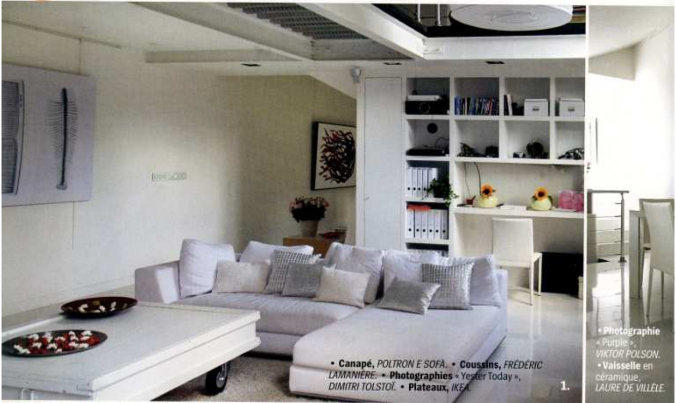
• Canapé, POLTRON E SOFA. • Coussins, FRÉDÉRIC LAMANIÈRE. • Photographies « Yester Today », DIMITRI TOLSTOÏ. • Plateaux, IKEA.