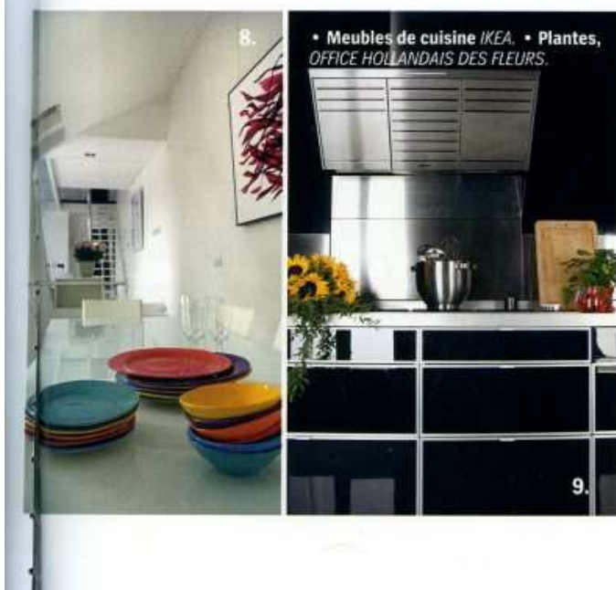
• Meubles de cuisine IKEA . • Plantes, OFFICE HOLLANDAIS DES FLEURS .

1. Dans le salon, le blanc invite au repos. Lisse, brillant et laiteux, le sol en résine se fond dans le décor. 2. Mobilier design pour la salle à manger. 3. L'escalier droit en bois peint en blanc (Leroy Merlin) est dissimulé par un garde-corps. Il se prolonge en une passerelle graphique, qui délimite un petit espace détente. 4. La nuit, les jeux de lumière transforment l'ambiance. L'imposante hotte de la cheminée à gaz sert d'écran de projection. 5. Parfaite intégration